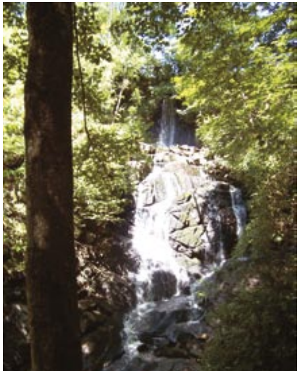
Cascade des Gorges de Narvau