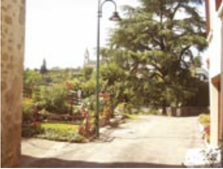
Rue de la Creuse, Lormes