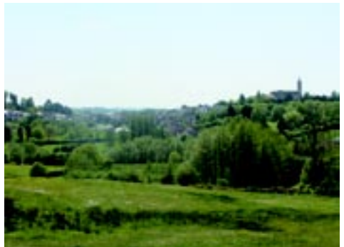
Vue de Lormes